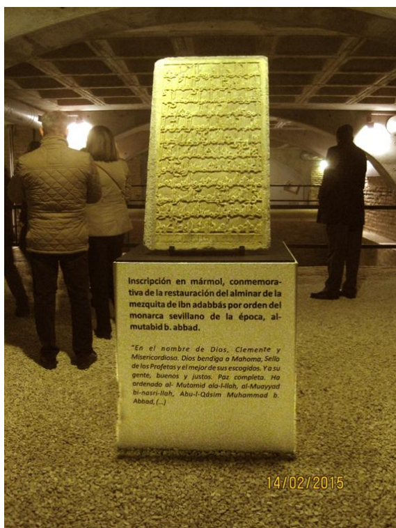
Inscripción en mármol, conmemorativa de la restauración del alminar de la mezquita de Ibn Adabbás por orden del monarca sevillano de la época, almutabid b. abbad.

"En el nombre de Dios, Clemente y Misericordioso. Dios bendiga a Mahoma, Sello de los Profetas y el mejor de sus escogidos. Ya su gente, buenos y justos. Paz completa. Ha ordenado al- Mutamid ala-l-lah, al-Muayyad bi-nasri-llah, Abu-l-Qásim Muhammad b. Abbad, (...)