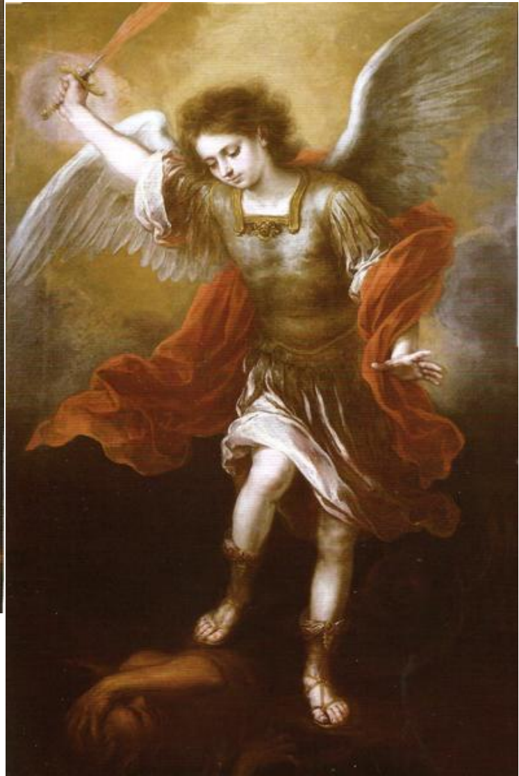
Arcángel San Miguel. Hacia 1665 1666. Kunsthistorisches Museum, Viena