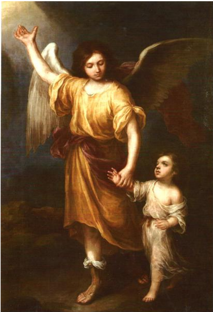
Ángel de la Guarda, (173) Hacia 1665 1666. Capilla del Ángel de la Guarda de la Catedral de Sevilla.