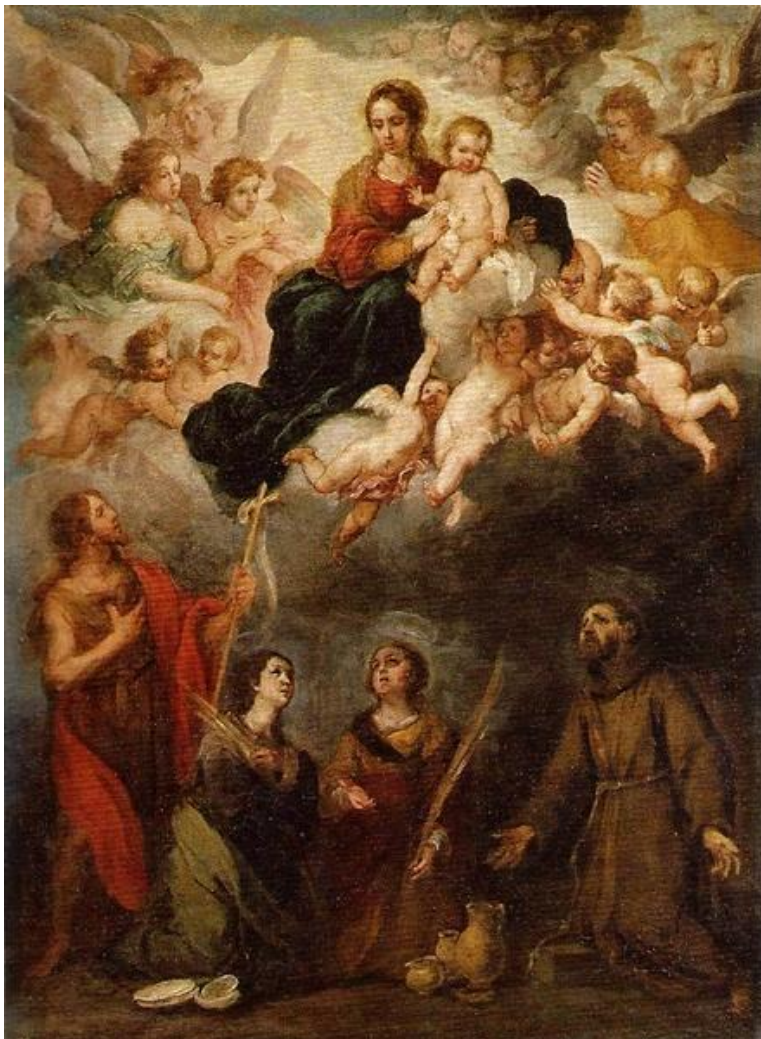
Virgen con el Niño y santos. Hacia 1665 1670. The Wallace Collection, Londres