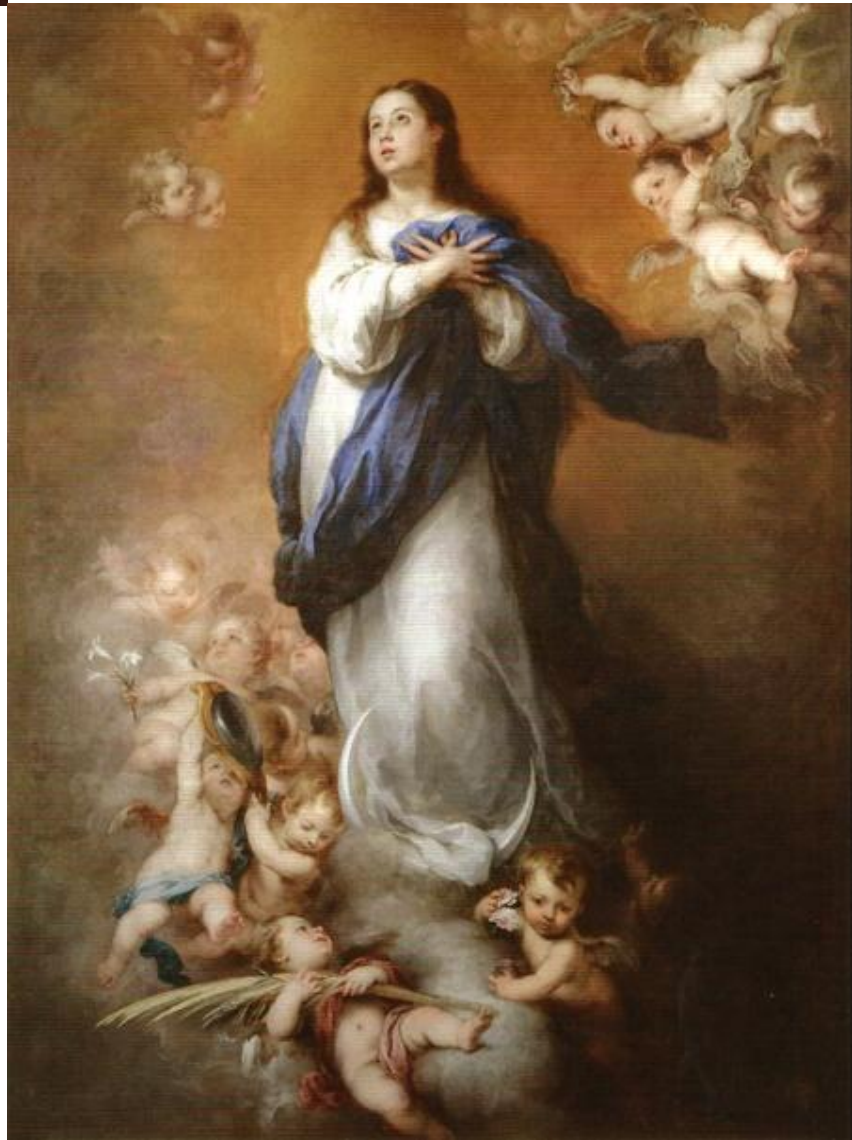
Inmaculada Concepción, la Niña , (209) Hacia 1668 1669. Museo de Bellas Artes de Sevilla