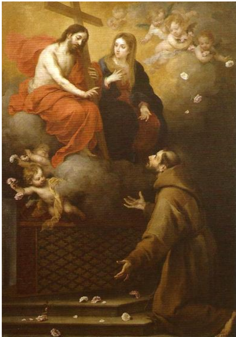
Visión de san Francisco en la Porciúncula. 1670 1680. Museo Nacional del Prado