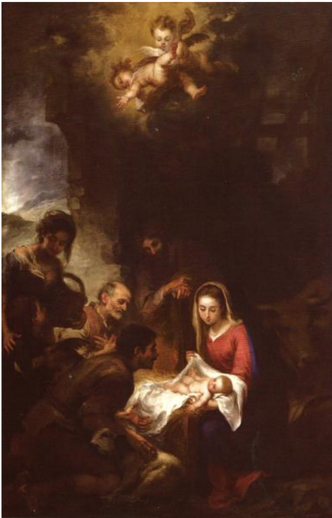
Adoración de los pastores , (197) Hacia 1668 1669. Museo de Bellas Artes de Sevilla